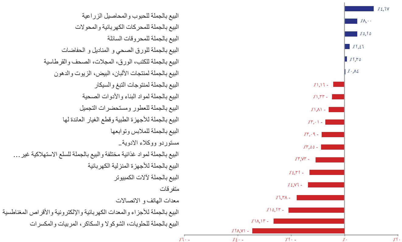
مكوّن مبيعات الجملة ما بين الفصل الأول من ٢٠١٦ والفصل الأول من ٢٠١٥

وبالرجوع الى نتائج الفصل الأول من العام ٢٠١٦ بالتفصيل. بالمقارنة مع مستويات النشاط في الفصل الأول لسنة ٢٠١٥. يمكن الإشارة إلى التراجع الحقيقي في أرقام أعمال معظم قطاعات تجارة الجملة، ولا سيما تلك التي كانت قد شهدت تحسّناً في الفصل الماضي (أي الفصل الرابع من العام ٢٠١٥). إنما عادت وشهدت تراجعاً خلال الفصل الأول للسنة، على الشكل التالي: